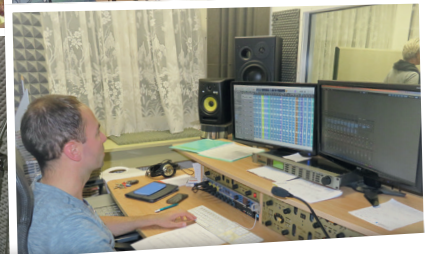
...so ist unser Tonträger entstanden...